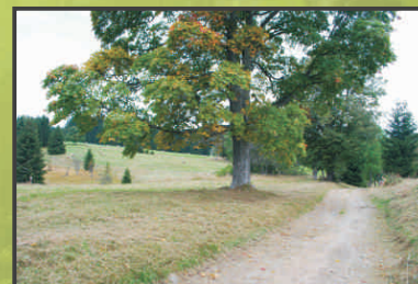
Cesta z Kamence do Pohoří na Šumavě

Pokračujeme v cestě. Procházíme kolem přírodní památky Prameniště Pohořského potoka. Po nějaké době se k nám zprava připojí cesta vedoucí k Šancím a posléze zleva i cesta ze zaniklé hutě Pavlína. Tím se k nám také napojuje cyklotrasa č. 1193. Před sebou jsme již zahlédli domy, a tak víme, že se blížíme k cíli. Ještě dvakrát sejdeme k přítokům Pohořského potoka a ocitneme se v nejnižším bodě dnešní cesty. Poté již přicházíme zpět do Pohoří na Šumavě. Prohlédneme si kostel a hřbitov a jdeme cestou nahoru k parkovišti. Dokážete si představit, že jdeme po hlavní ulici, podlouhlém náměstí, lemovaném desítkami domů?