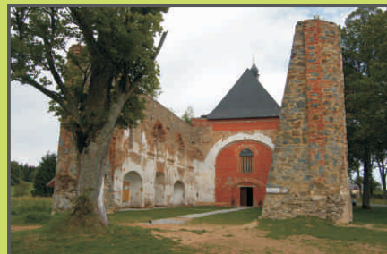
Kostel v Pohoří na Šumavě