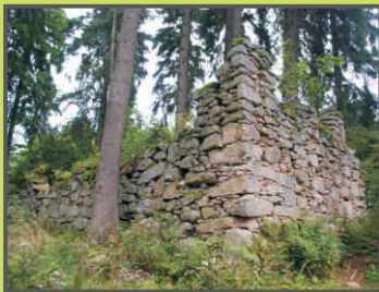
Hostinec pod Kamencem