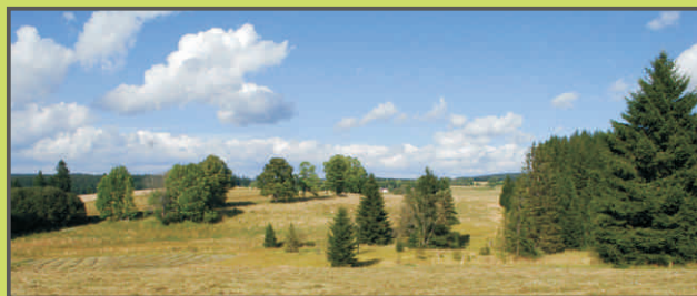
Pohoří na Šumavě