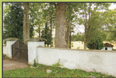
Hřbitov v Pohoří na Šumavě

Vážení návštěvníci, ocitáme se na samém jihu české části Novohradských hor. Kromě výstupu na nejvyšší vrchol těchto hor, máme dnes v plánu připomenout si osudy zaniklých obcí Pohoří na Šumavě, Šance a Steinberg. Několik kilometrů půjdeme po státní hranici. Mnohokrát přejdeme z Čech do Rakouska a zpět a vůbec nám to nepřijde zvláštní. Stejně jako lidem, kteří zde do poloviny 20. století žili.