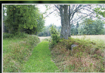
Cesta po hranici