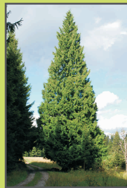
Památný zerav obrovský

V tuto chvíli Pohoří na Šumavě opouštíme a na rozcestí se dáváme doprava. Cestou vlevo bychom šli po cyklistické trase č. 1193 a na první křižovatce se napojili na Vrcholovou trasu. Nás bude 1,5 km ke státní hranici provázet zelené turistické značení KČT. Když po této cestě jdeme, ani nás nenapadne, že kdysi to bývala významná spojnice mezi Kaplicí a Weitrou. Několik desítek metrů před hranicí zbystříme, a pokud nejsou louky pokosené, hledáme vlevo vyšlapanou pěšinku. Vede k turistickému odpočívadlu a informačnímu panelu, pod kterými je studánka s českým „nepravým“ pramenem Lužnice. Ten pravý nalezneme v Rakousku na úbočí hory Eichlberg (1054 m n. m.) nedaleko odsud.