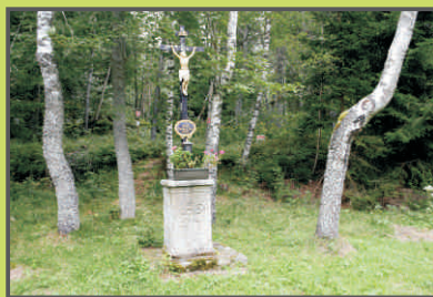
Křížek na Stodůleckém vrchu