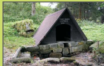
Český pramen Lužnice