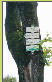
Pohoří na Šumavě