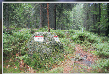
Cesta po hranici