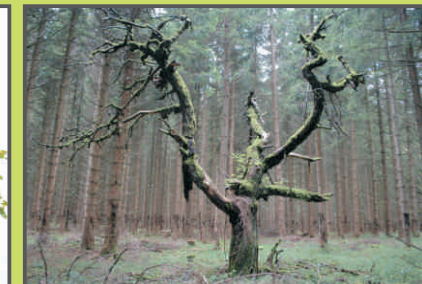
Strom na Šancích