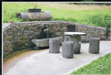
Studánka Antonius Quelle