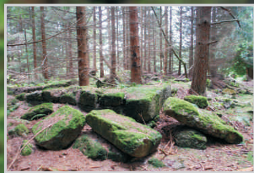
Rozvaliny u památného zeravu

s nápisem „nach Sandl“. Odtud se až k Šancím budeme držet spíše rakouského značení, než hraničních patníčků. Je to schůdnější trasa. Cestou potkáme historický hraniční kámen, boží muka a další pitný pramen s názvem Stadlberg. I zde za posezení a možnost doplnění tekutin vděčíme rakouskému okrašlovacímu spolku. Občerstvení scházíme k zaniklé obci Šance. Nad potokem zde stojí barokní hraniční sloup z roku 1661 . Označuje hranici tří historických zemí – Čech, Dolních a Horních Rakous. Dnes však stojí několik desítek metrů v Rakousku. Ani hranice států nejsou neměnné. Ale přesto se jedná o historický hraniční kámen a my musíme najít dnešní první kešku. Bude někde v blízkém okolí.