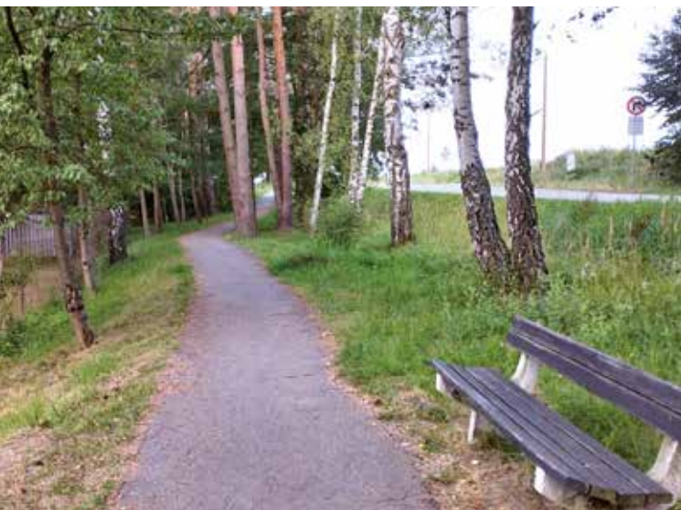
Cesta z Borovan

Delší varianta vede samotnými Radosticemi, kde za autobusovou zastávkou odbočíme vpravo, a potom po silnici a zároveň cyklostezce č. 1121 kolem rybníčku až na hlavní cestu. Tu přejdeme a stále po vedlejší silnici až na křižovatku, kde odbočíme vpravo na ulici Vodárenskou, kudy se kolem vodojemu a autobusového nádraží dostaneme až na náměstí v Borovanech.