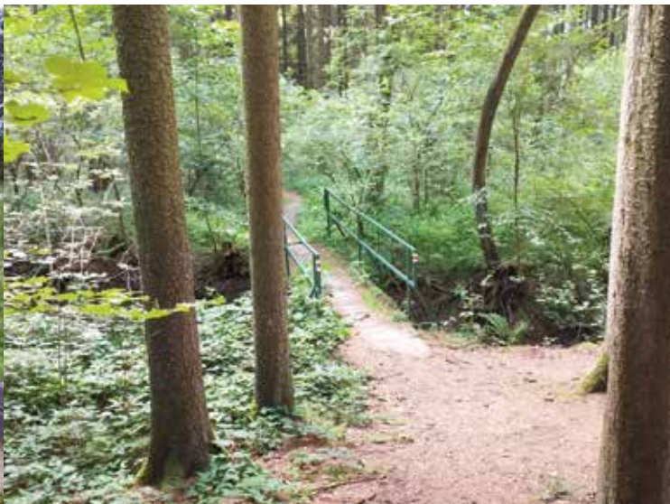
Můstek přes Trocnovský potok