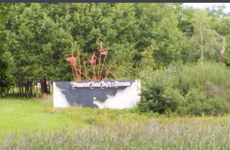
Poutač na Památník Jana Žižky