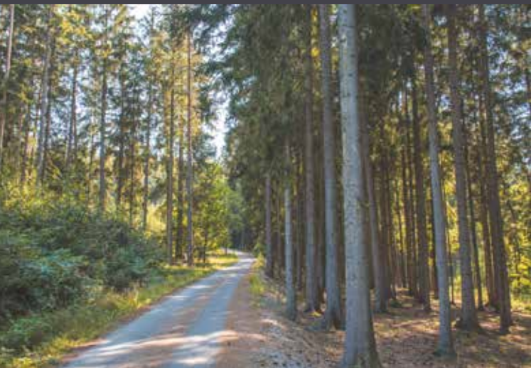
Les nad Trajerovo Mlýnem