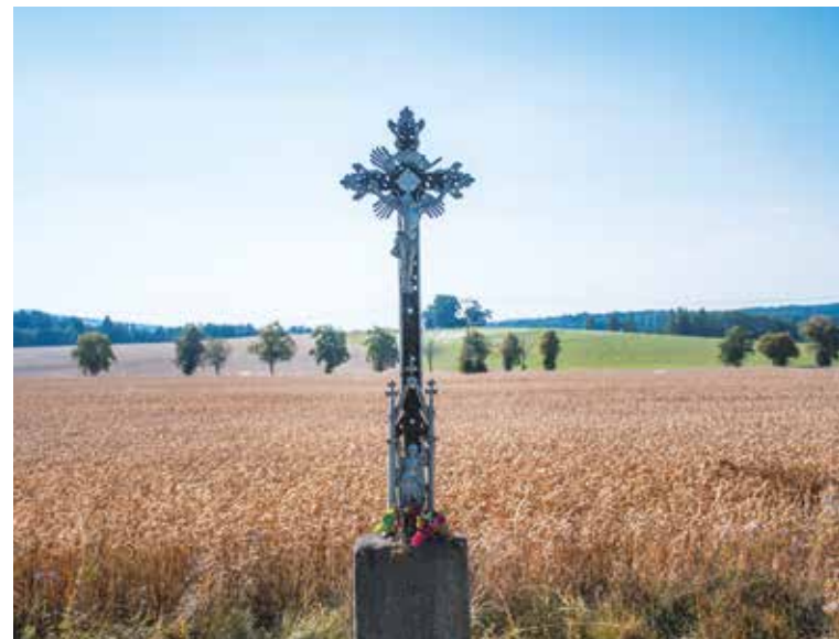
Kříž mezi poli

na šesticípé hvězdě, celý kostel doprovází princip trojnosti. Ten symbolicky odkazuje na zasvěcení chrámu k nejsvětější trojici. U chrámu se na jižní straně také nachází naše poslední skrytá schránka. Po jejím nález a prohlédnutí této chráněné památky nám nezbývá nic jiného, než odejít po naučné stezce rovnou cestou mezi poli až zpátky do Trhových Svinů.