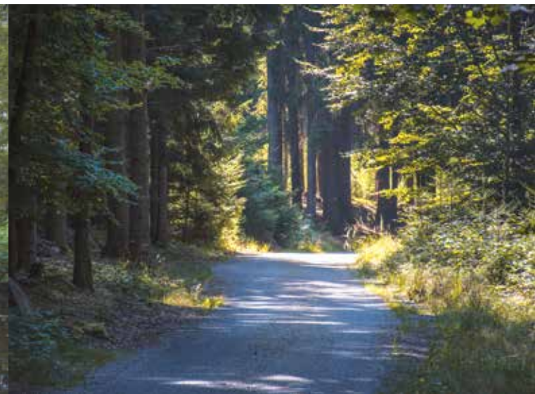
Lesní cesta na Svatou Trojici

na šesticípé hvězdě, celý kostel doprovází princip trojnosti. Ten symbolicky odkazuje na zasvěcení chrámu k nejsvětější trojici. U chrámu se na jižní straně také nachází naše poslední skrytá schránka. Po jejím nález a prohlédnutí této chráněné památky nám nezbývá nic jiného, než odejít po naučné stezce rovnou cestou mezi poli až zpátky do Trhových Svinů.