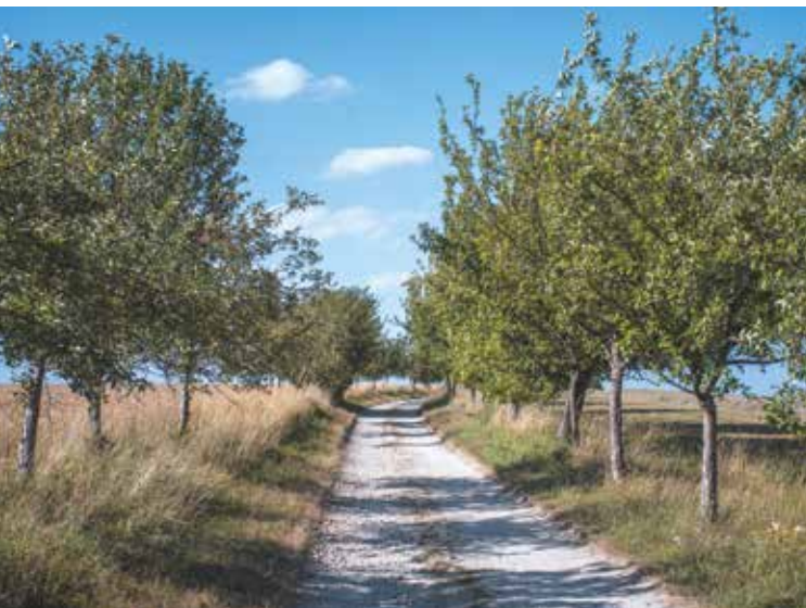
Cesta mezi poli do Trhových Svinů