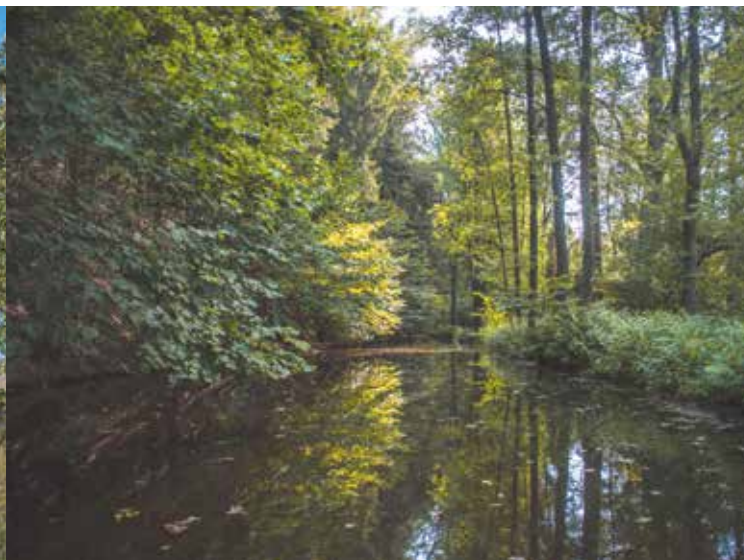
Náhon Klenského potoka

Trasu začneme na autobusovém nádraží v Trhových Svinech. Využijeme toho, že naše celá trasa vede v protisměru naučné stezky Trhosvinensko. Ta nás vyvede z města po levém břehu Svinenského potoka do ulice Nová a Sadová, ve které po chvíli odbočíme vlevo. Tak se dostaneme kolem garáží až na louku nad Trhovými Sviny. Odtud vede cesta s výhledy na město, která nás zavede až k prvnímu cíli naší trasy. Je to hamr z 18. století známý jako Buškův Hamr. Byl postaven na toku Klenského potoka, který sem teče uměle vytvořeným náhonem. Ten roztáčí tři vodní kola, která pohání brus, dmychadla a samotný dubový buchar. Buchar nese jméno Kobyla a s hmotností 300 kg se jedná o největší buchar v České republice. Hamr fungoval