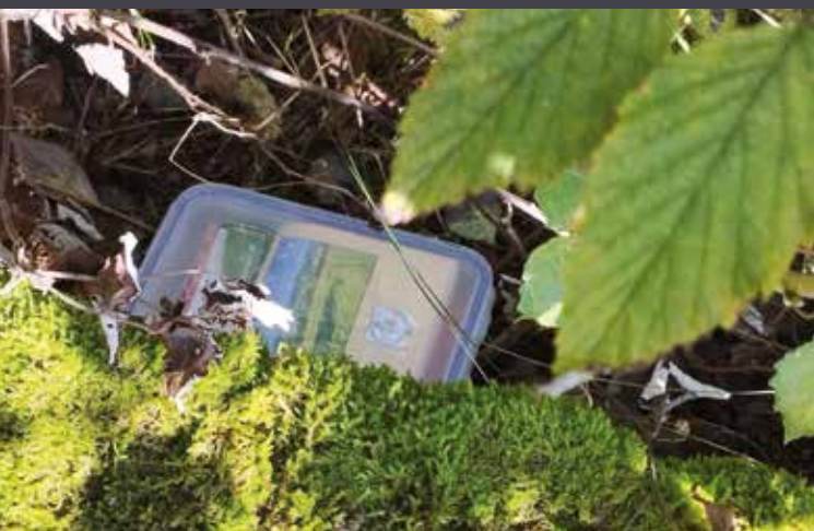
Jedna ze skrytých schránek