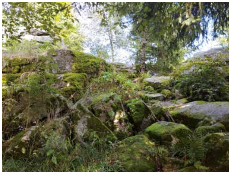
Skály na vrcholu Kohoutu

Trasu začneme v obci Klení a to po žluté turistické značce. Ta nás zavede nad Klení, kde odbočuje doprava. Projedeme mezi chalupami na louku nad nimi. Kolem kříže pořád po žluté dojdeme až na cyklostezku č. 1187, kde odbočíme vpravo a pokračujeme až na rozcestník. Zde se dáme doleva a před námi se objeví chalupa s názvem Myslivna. Zde si na lavičce pod přístřeškem odpočineme po výšlapu a načerpáme síly na ten před námi. Po odpočinku odbočíme na červenou turistickou cestu směrem na Vysoký kámen a vejdem do lesa. Zde cesta vede zpevněnou cestou až na rozcestí pod vrcholem, kde červená značka zahýbá vlevo. Začneme vrcholový výšlap a těsně pod vrcholem se nám za dobré viditelnosti otevře výhled na kraji-