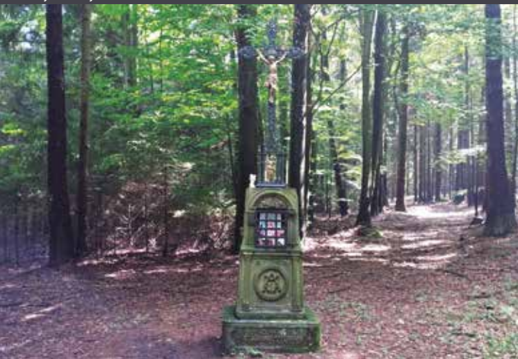
Kříž na rozcestí