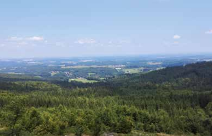
Výhled z Vysokého kamene