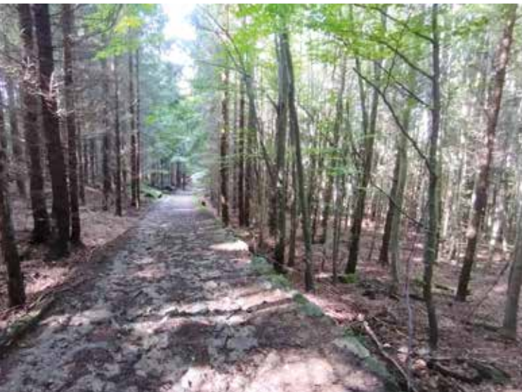
Cesta na Vysoký kámen

Pokud jste přijeli autobusem nebo snad již dále jít nechcete, můžete se dát od studánky směrem od vrcholu až na křížení cest. Zahněte vpravo dolů, až dojdete na křížení u krásného kříže. Zde můžete zahnout doleva a dojít tak po krátké cestě do Besednice, nebo zahnout doprava a sejít kopec až na asfaltovou cestu pod ním a na té se dát doprava. Tak dojdete až do obce Dobrkovská Lhotka. Pokud jste ale přijeli autem a máte ho odstavené v obci Klení, kde jsme trasu začali, musíte se vrátit na asfaltovou cestu, po které jsme sem přišli, a po té až pod Myslivnu a dále po žluté jako na začátku naší trasy.