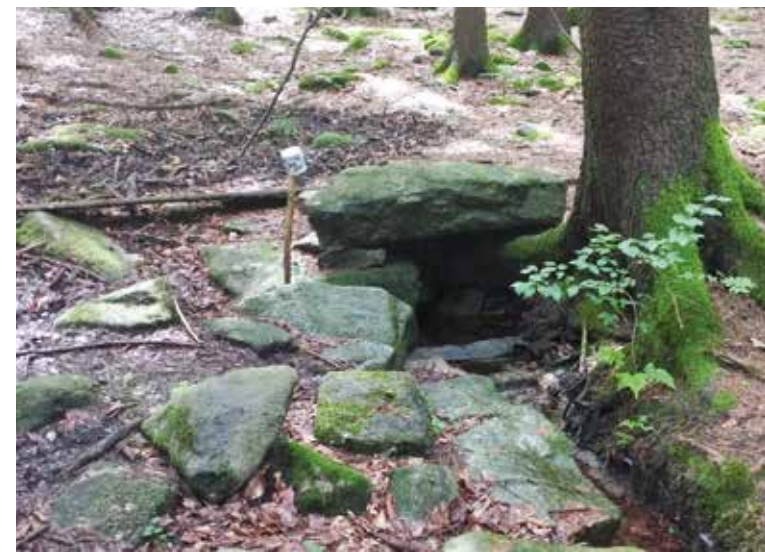
Studánka pod Velkým kamenem