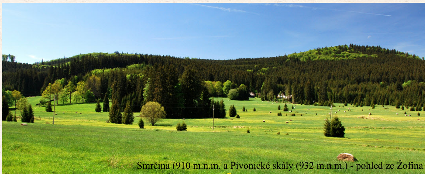
Smrčina (910 m.n.m. a Pivonické skály (932 m.n.m.) - pohled ze Žofina

Lidé dlouho nepřemýšleli a rozhodli, že se bude jmenovat po Hubertovi Pivovi-PIVO. Skalám se začalo říkat také po Hubertovi-PIVONICKÉ SKÁLY. Když dnes půjdete na skály v noci, uvidíte, jak tam duch Huberta rozdává pivo.