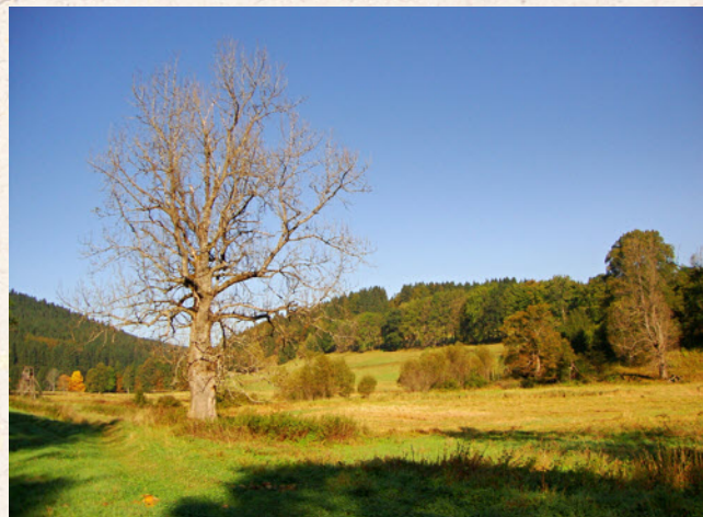
Znáte krásnější údolí než jsou Stříbrné Hutě?

došli k Huťskému rybníku, kde jsme se vyfotili a vydali se k Žofínu, vzdálenému dva a půl kilometru. Na Žofíně stával lovecký zámeček. Odtud už jsme jeli domů.