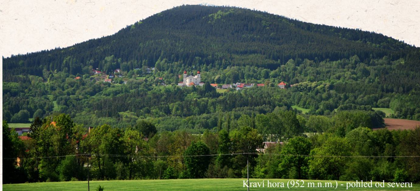
Kraví hora (952 m.n.m.) - pohled od severu