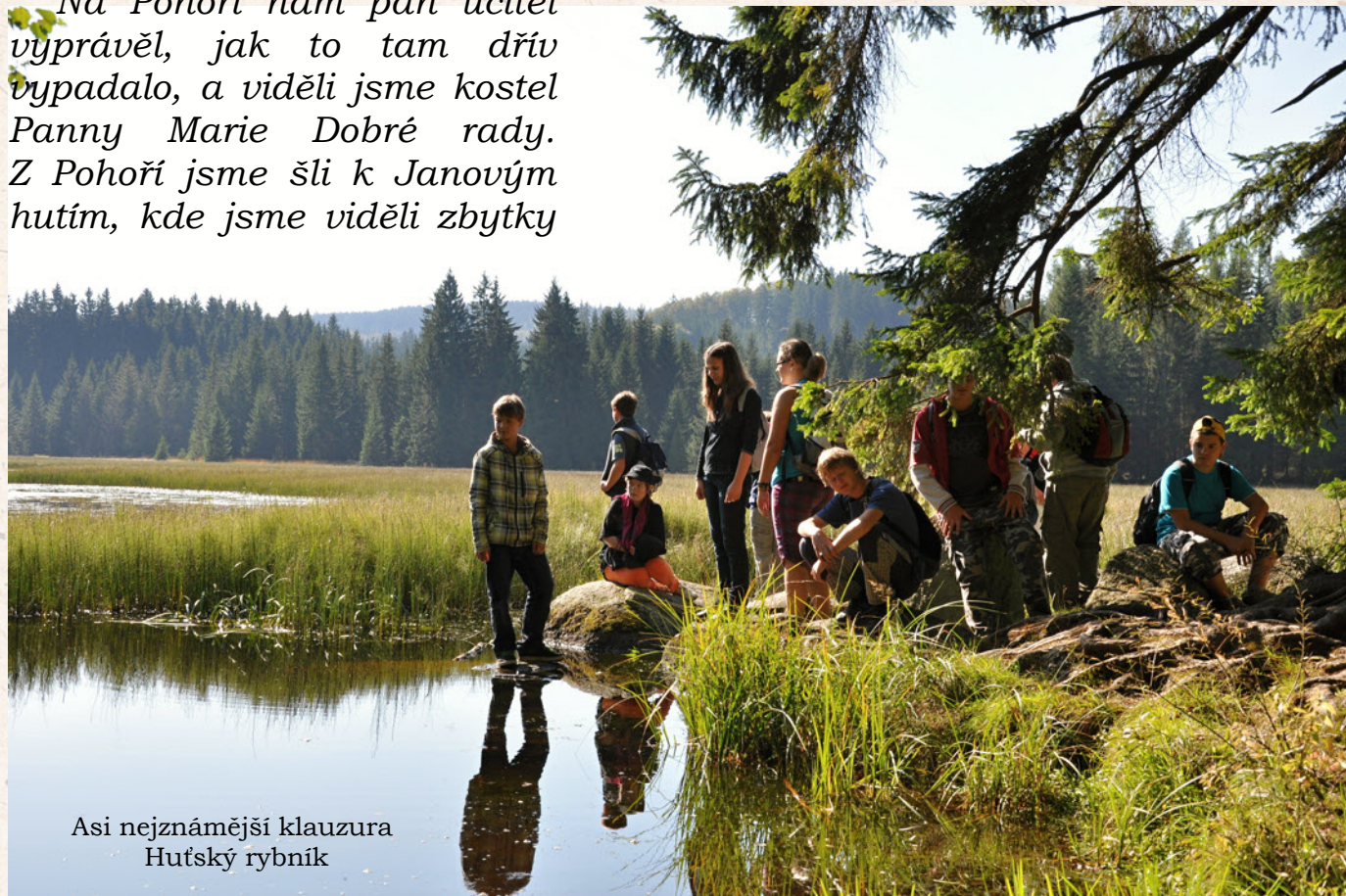
Asi nejznámější klauzura Huťský rybník

Na Pohoří nám pan učitel vyprávěl, jak to tam dřív vypadalo, a viděli jsme kostel Panny Marie Dobré rady. Z Pohoří jsme šli k Janovým hutím, kde jsme viděli zbytky