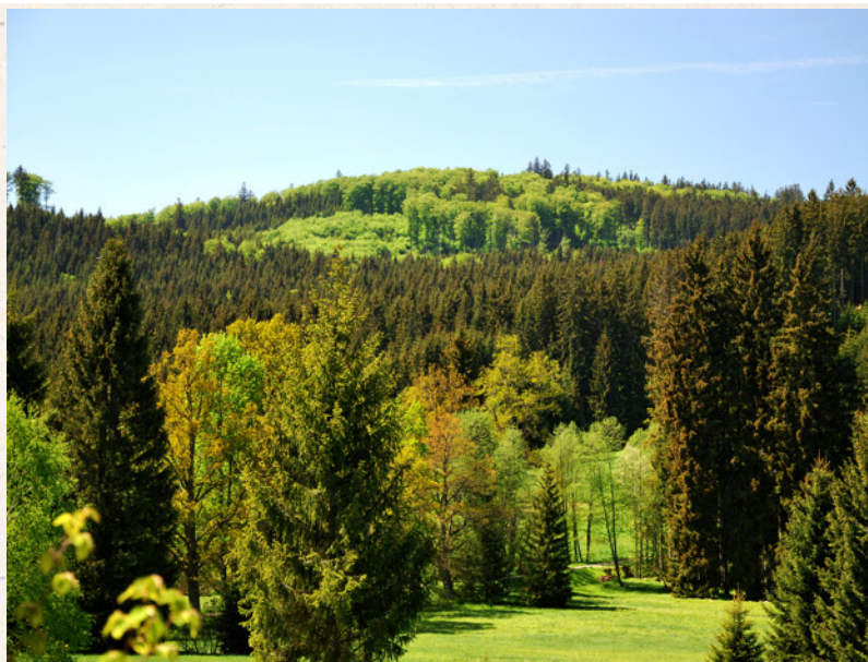
Smíšený les na Pivonických skalách

Jednou šel pozdě domů, když v tom se před ním objevil dědeček. "Chlapče, já vím, že hledáš recept na lék a já ho mám a dám ti ho, protože máš dobré srdce. Víš, to jsem byl já, kdo nechal zmizet onen zázračný lék." pravil a vypařil se jako pára. Hubert přemýšlel, co to bylo za dědečka, jestli to byl duch nebo čaroděj. Pak poděkoval a utíkal darovaný